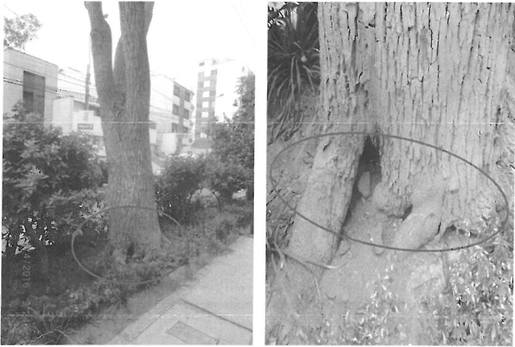
Fig. N° 03 y Fig. N° 04. Oquedad pronunciada en la base del fuste.