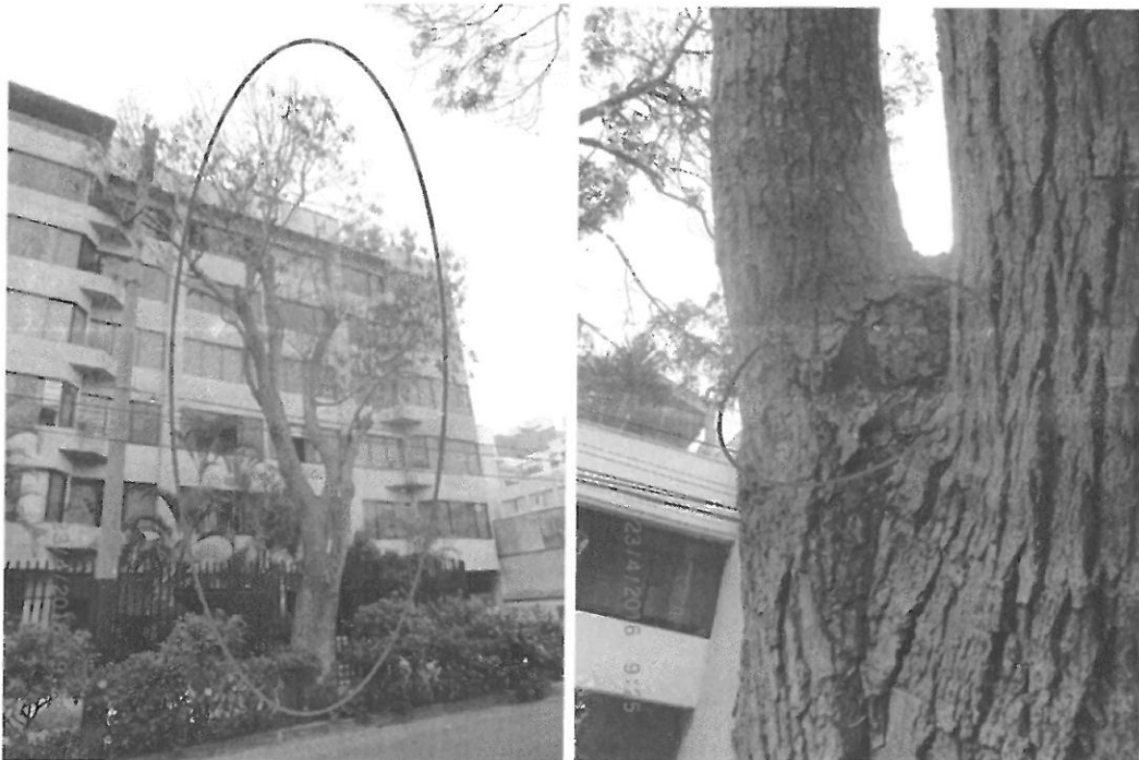
Fig. N° 01 y Fig. N° 02. Árbol de la especie “Fresno” parcialmente defoliado y con desprendimiento de ritidoma en la bifurcación.