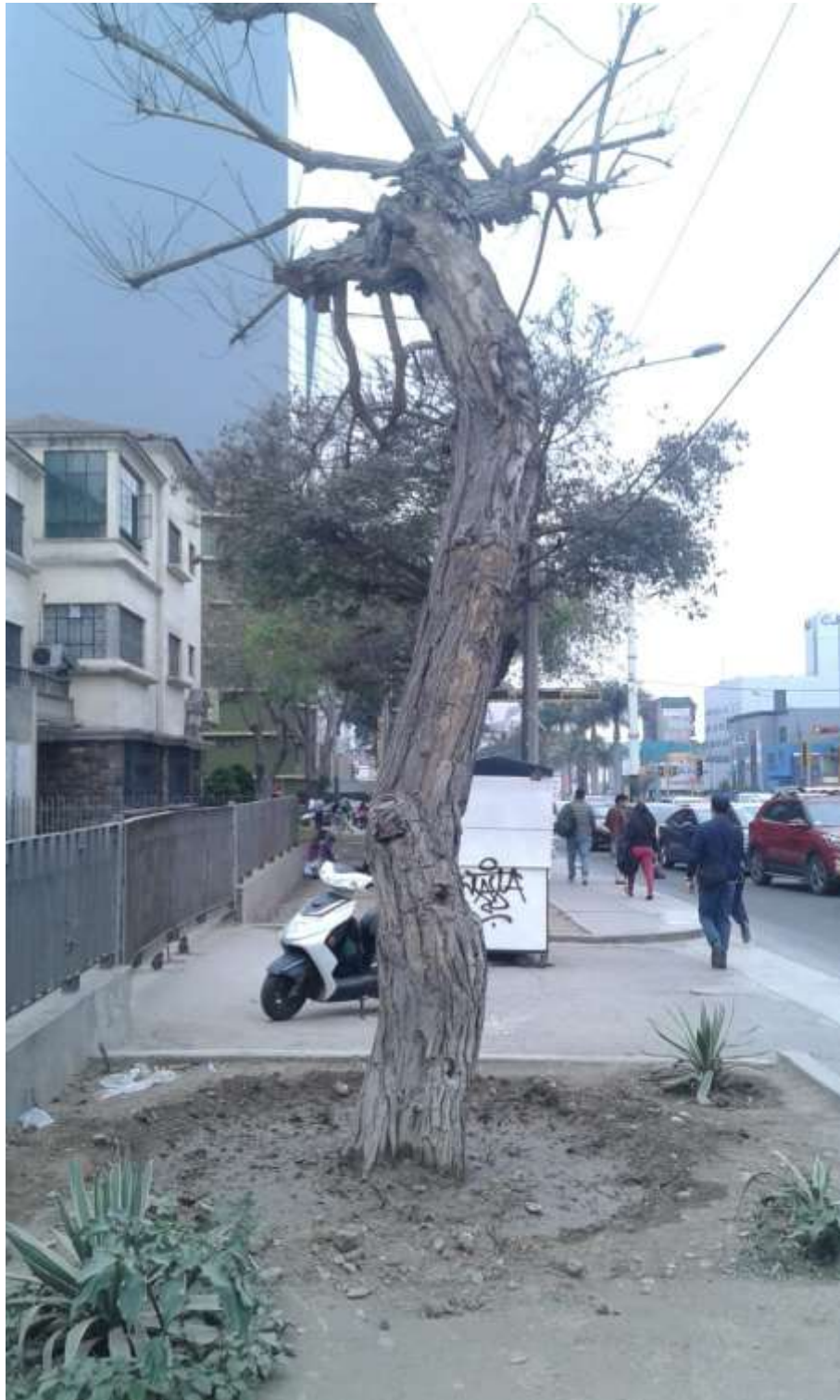
Foto N° 01 Tipa ubicado en la Av. Javier Prado Este 656, antes de inicio de las obras de infraestructura.