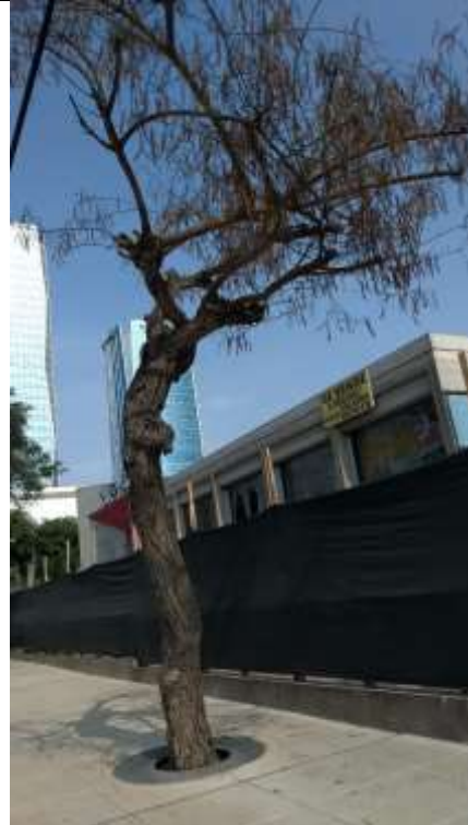
Foto N° 05 Árbol de tipa con obras de infraestructura culminada de fecha 19.02.19.