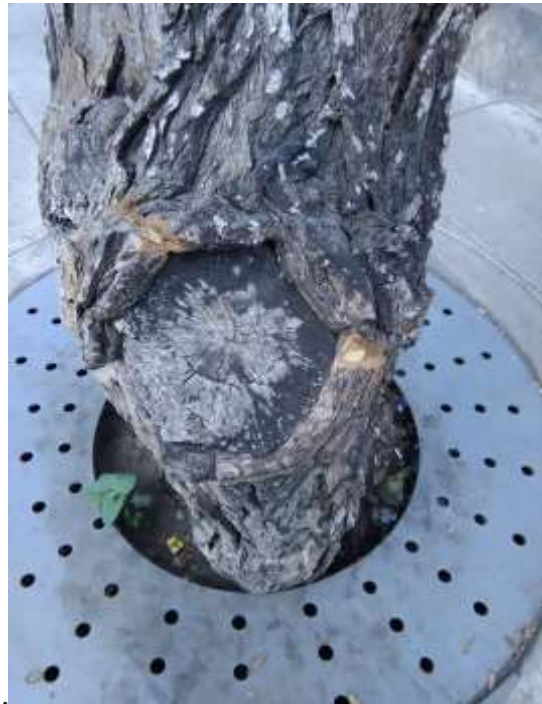
Foto N° 07 Vista de la infraestructura de metal colocada en la base del fuste que impide realizar las labores silviculturales como riego, fertilización, aerado.