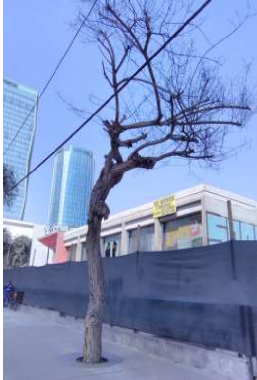
Foto N° 09 Vista panorámica del árbol muerto en pie.