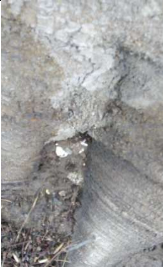
Foto N° 05 Base del fuste con presencia de basidiocarpos alrededor.